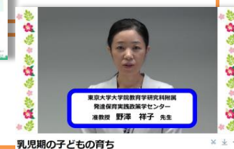
乳児期の子どもの育ち